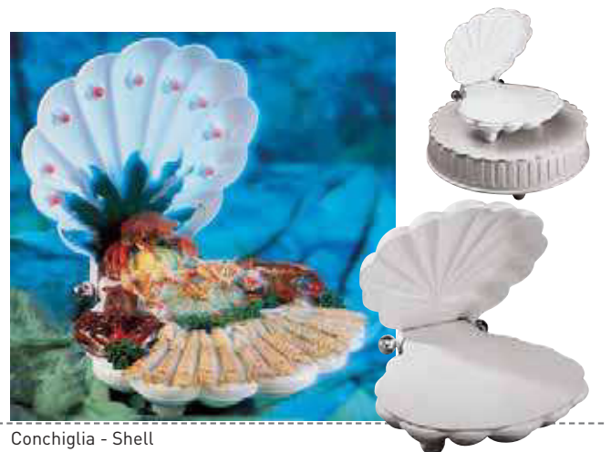
Conchiglia - Shell

La base può essere riempita di ghiaccio. Può essere utilizzata con la base 47910-AA. Fino a 120/140 porzioni. - The base can be filled with ice to keep food fresh. Can be used with base 47910-AA. - Up to 120/140 portions.