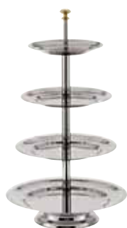
Alzata frutta, 4 piani, inox Fruit stand, 4 tiers, s/s Obstständer, 4-stöckig, Edelstahl Serveur muet, 4 étages, inox Frutero, 4 alturas, inox