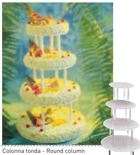
Colonna tonda - Round column

Quattro piani utili: cm ø 39, cm ø 34, cm ø 29, cm ø 24. Four levels: cm ø 39, cm ø 34, cm ø 29, cm ø 24.