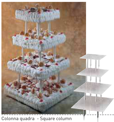
Colonna quadra - Square column

Quattro piani utili: cm 40x40, cm 35x35, cm 30x30, cm 25x25. Four levels: cm 40x40, cm 35x35, cm 30x30, cm 25x25.