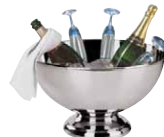
Coppa punch, inox Punch bowl, s/s Punchbowle, Edelstahl Rostfrei Rafraîchisseur, inox Ponchero, acero inox