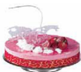
Alzata torta, inox Cake stand, s/s Tortenplatte, Edelstahl Rostfrei Gueridon pâtissier, inox Pedestal para tartas, inox