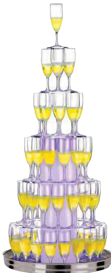
Cascata champagne, inox Champagne Waterfall, stainless steel Sekt Wasserfall,Edelstahl Rostfrei Cascade à champagne, inox Cascada champaña, inox

Illuminazione della colonna, 12V. Prodotto NON consigliato per liquidi gasati o champagne. - With light inside the column, 12V. NOT recommend for use with fizzy drinks or champagne.