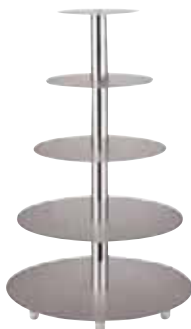
Alzata per torte, alluminio Wedding cake stand, aluminium Hochzeitstortenständer, Aluminium Support pour tourte de mariage, alu Pedestal para tartas, aluminio