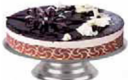
Alzata torta, inox Cake stand, s/s Tortenplatte, Edelstahl Rostfrei Gueridon pâtissier, inox Pedestal para tartas, inox