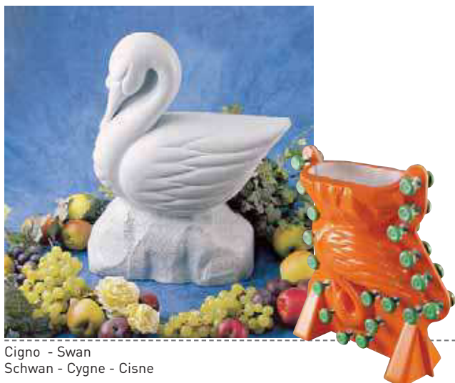
Cigno - Swan Schwan - Cygne - Cisne