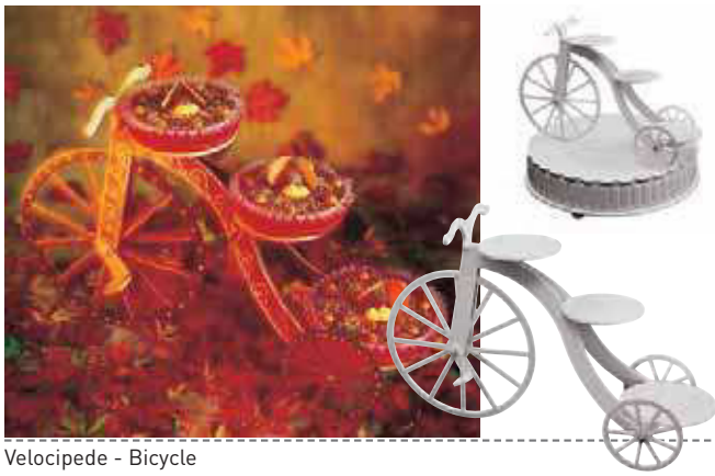
Velocipede - Bicycle

Tre piani utili: 2 ø 22 cm, 15 ø 26 cm. Può essere utilizzata con la base 47910-AA - Fino a 110/120 porzioni. - Three levels: 2 ø 22 cm, 1 ø 26 cm. Can be used with base 47910-AA - Up to 110/120 portions.