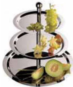
Alzata frutta, 3 piani, inox Fruit stand, 3 tiers, s/s Obstständer, 3-stöckig, Edelstahl Etagère à fruits, 3 étages, inox Frutero 3 pisos, inox

Ciotola inox . Struttura in filo cromato. Stainless steel pan, chrome plated wire.