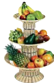
Alzata frutta, RATTAN Fruit stand Büffet-Etagère Etagère à fruits Expositor de frutas