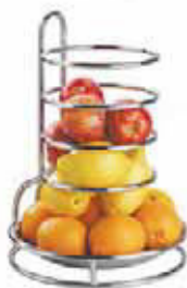
Ciotola porta frutta, inox Fruit bowl, stainless steel Obstschale, Edelstahl Rostfrei Bol à fruits, inox Bol de frutas, inox