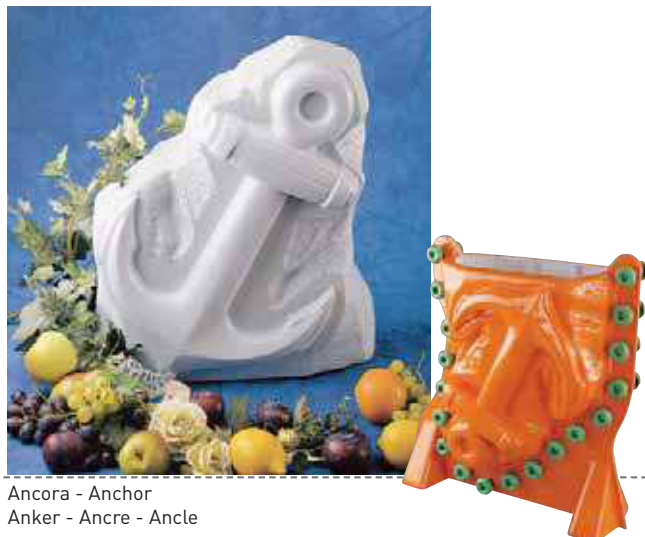
Ancora - Anchor Anker - Ancre - Ancle