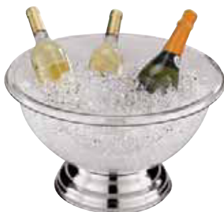
Coppa punch, polycarbonato Punch bowl, PC Punchbowle, PC Rafraîchisseur, PC Ponchero, PC