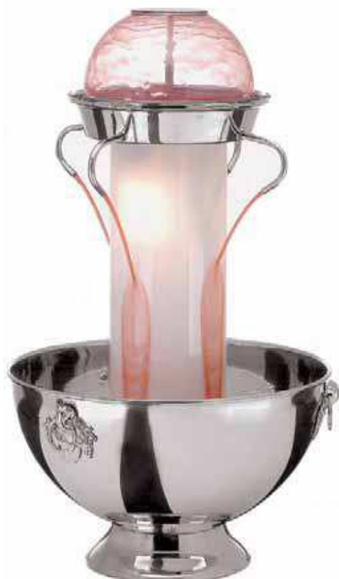
Fontana cocktails, inox Cocktail fountain, s/s Cocktails-Laufbrunnen, Edelstahl Fontaine à cocktails, inox Fuente cocktail, inox