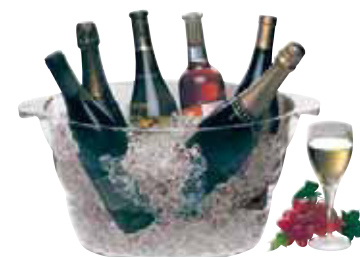
Secchio champagne, acrilico Wine party tub, acrylic Flaschenkühler-Bowle, acryl Rafraîchisseur à bouteilles, acrylique Ponchero, acrílico