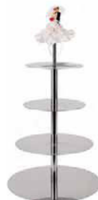
Alzata torta, 5 piani, inox Cake stand, 5 tiers, s/s Kuchenständer, 5-stöckig, Edelstahl Presentoir pâtissier, 5 étages, inox Pedestal para tartas, 5 alturas, inox