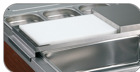
Forniti di serie