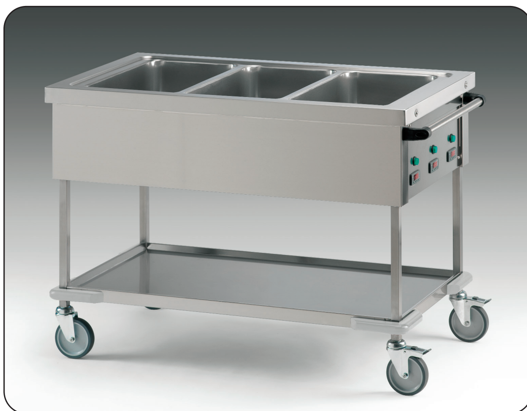
Art. 1375 + Art. A3207