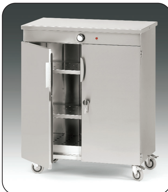
Art. 96120 + Art. A3215