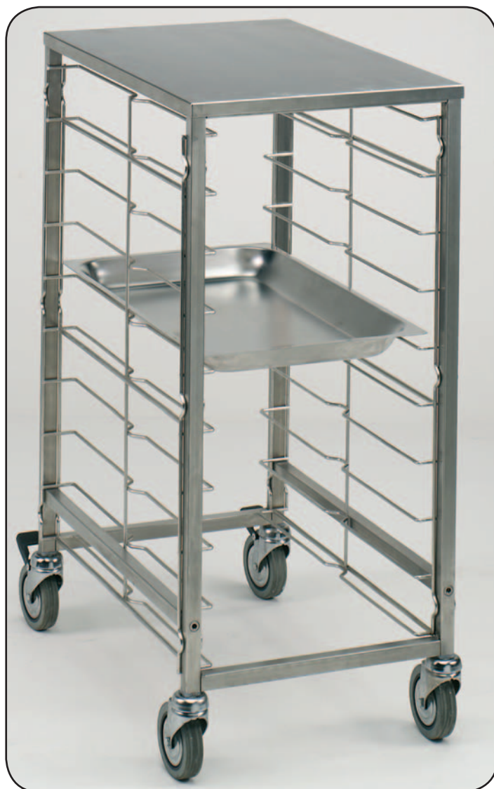
Art. 2080 + Art. A3203