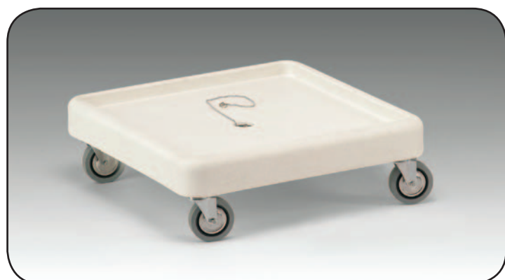
Art. 2206 P