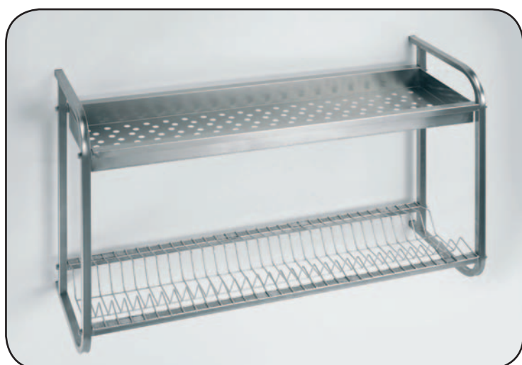
Art. 1267 PB

N. 1 piano portapiatti Portata ca. 37 piatti N. 1 cestello in lamiera di acciaio inox forata, dim. est. cm. 98x27x58 h.