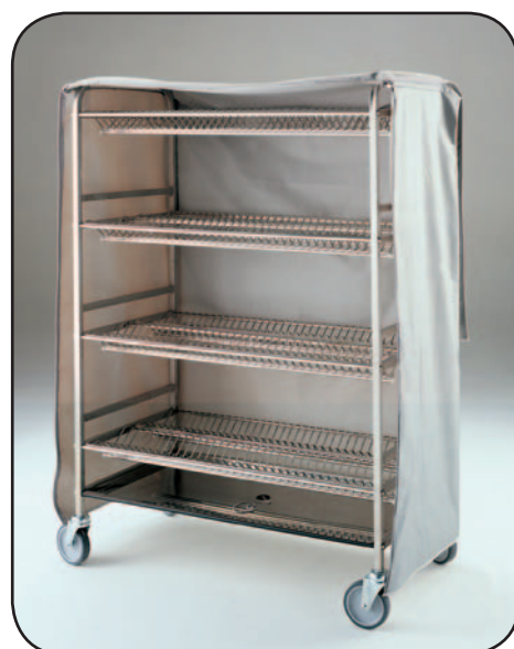
Art. 1262 + Art. A0262