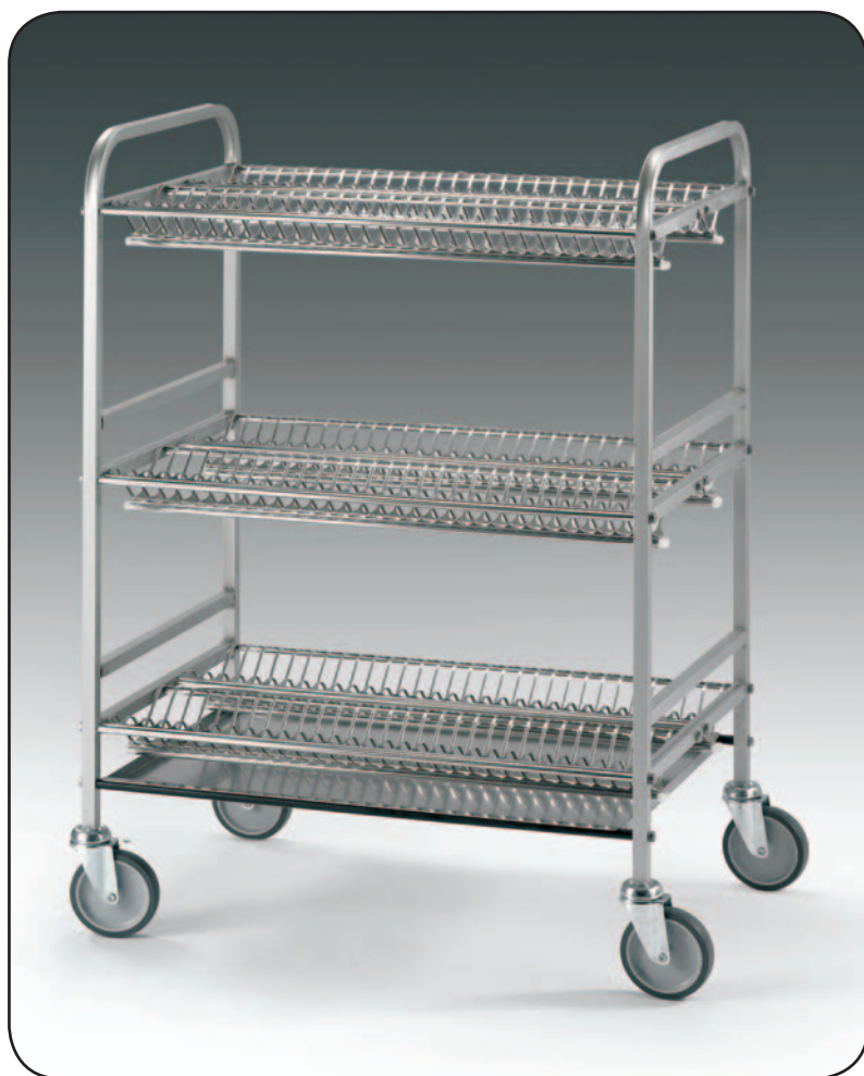
Art. 1260 I