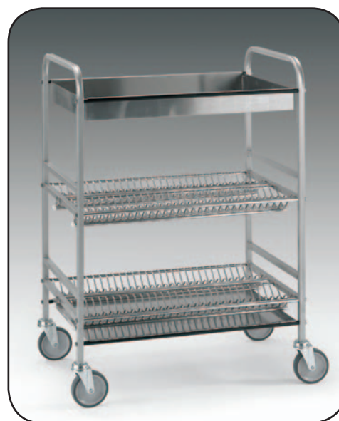
Art. 1260 IX

N. 3 piani portata ca. 180 piatti N. 1 cestello in lamiera di acciaio inox forata, dim. est. cm. 84x56x147 h.