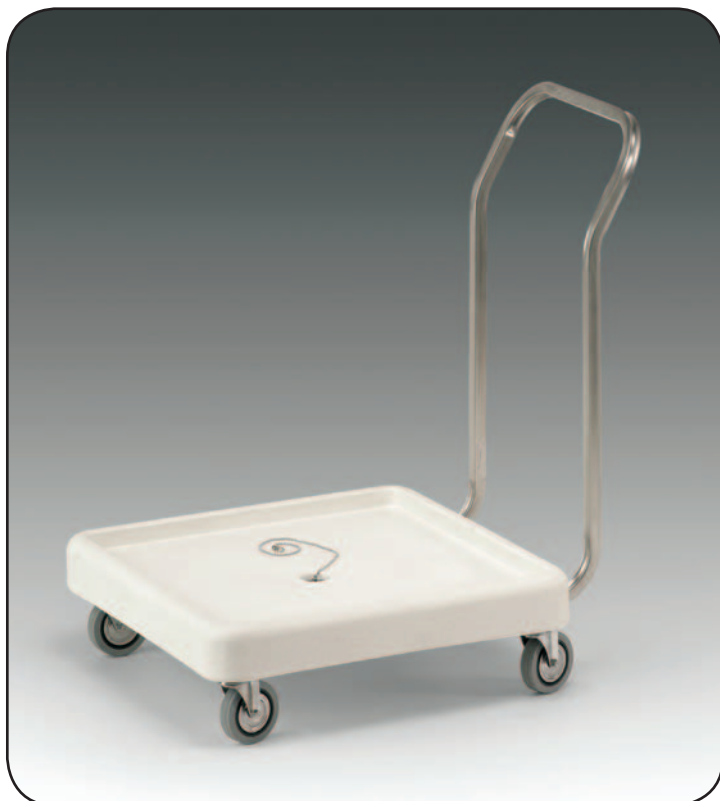
Art. 2205 P