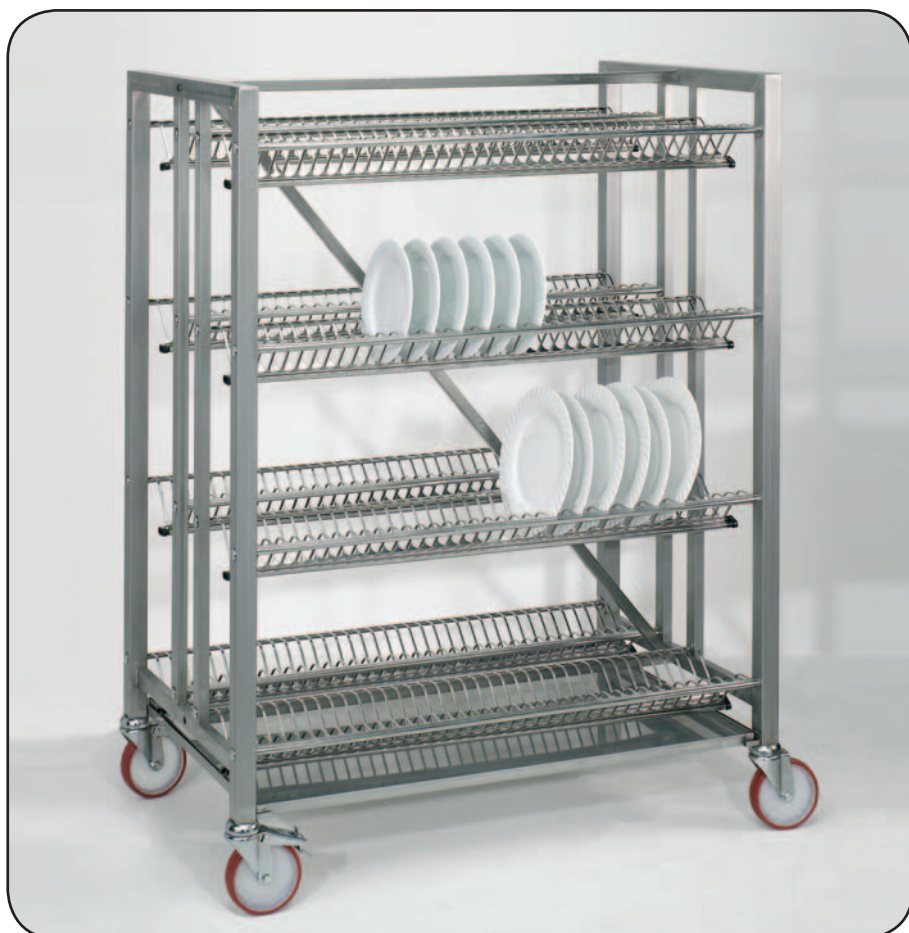
Art. 1269 + Art. A3210