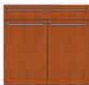
Art. 8020 Base 2 sportelli e 1 cassetto legno cm 90.