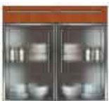
Art. 8050 Base 2 sportelli plexiglass e 1 cassetto legno cm 90.