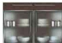
Art. 8055W Base 2 sportelli plexiglass e 2 cassetti legno cm 120.