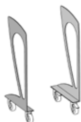
Art. 8000 Telaio basso con ruote cm 106 h.