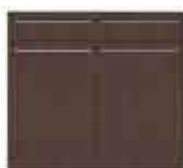
Art. 8020W Base 2 sportelli e 1 cassetto legno cm 90.