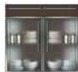
Art. 8050W Base 2 sportelli plexiglass e 1 cassetto legno cm 90.