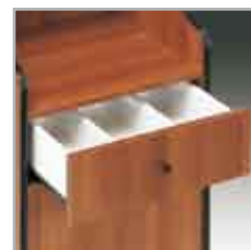
Cassetto con separatori, di serie in tutti i modelli.