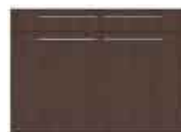
Art. 8025W Base 2 sportelli e 2 cassetti legno cm 120.