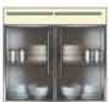
Art. 8065 Base 2 sportelli plexiglass e 1 cassetto laccato cm 90.