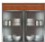
Art. 8050 Base 2 sportelli plexiglass e 1 cassetto legno cm 90.