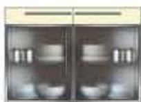
Art. 8070 Base 2 sportelli plexiglass e 2 cassetti laccati cm 120.