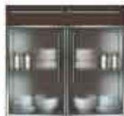
Art. 8050W Base 2 sportelli plexiglass e 1 cassetto legno cm 90.