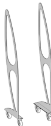
Art. 8010 Telaio alto con ruote cm 193 h.