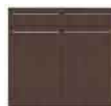
Art. 8020W Base 2 sportelli e 1 cassetto legno cm 90.