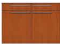
Art. 8025 Base 2 sportelli e 2 cassetti legno cm 120.