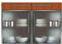
Art. 8055 Base 2 sportelli plexiglass e 2 cassetti legno cm 120.