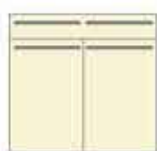
Art. 8035 Base 2 sportelli e 1 cassetto laccato cm 90.