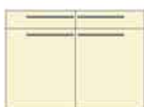
Art. 8040 Base 2 sportelli e 2 cassetti laccati cm 120.