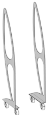
Art. 8010 Telaio alto con ruote cm 193 h.