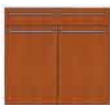
Art. 8020 Base 2 sportelli e 1 cassetto legno cm 90.