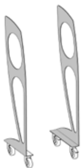
Art. 8005 Telaio medio con ruote cm 151 h.