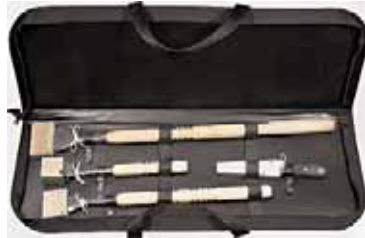
Set 4 pezzi scalpelli ghiaccio Four pieces ice chisel set Eismeissel set 4 stück 4 pcs set ciseau à glace Cinseles para hielo, 4 piezas