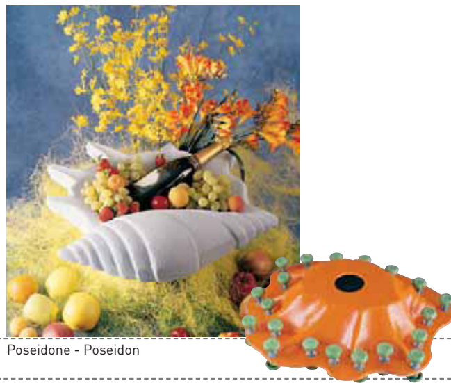
Poseidone - Poseidon