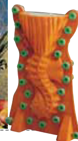
Cavalluccio marino - Seahorse Seepferdchen - Morse - Caballito de mar

art. cm. scultura/sculpture cm. stampo/mould kg. 47880R11 47x26 h. 56 67x29 h. 62 8