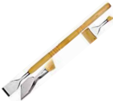
Scalpellino ghiaccio un lato smussato Big flat chisel Eismeissel Ciseau à glace Cinsel para hielo