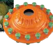
Artemide - Artemis Artemide

art. cm. scultura/sculpture cm. stampo/mould kg. 47880R17 39 h. 15 53 h. 19 4,5