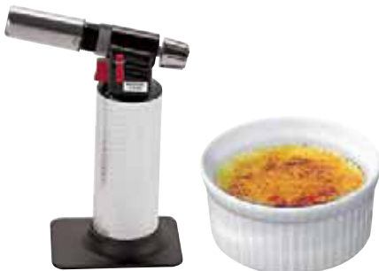
Cannello professionale Chef's torch Profi-Wärmepistole Chalumeau de cuisine Flambeador profesional