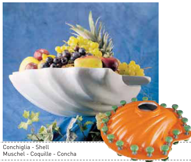
Conchiglia - Shell Muschel - Coquille - Concha