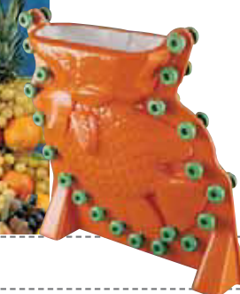
Pesce - Fish Fisch - Poisson - Pez

art. cm. scultura/sculpture cm. stampo/mould kg. 47880R08 58x25 h. 56 69x25 h. 70 8