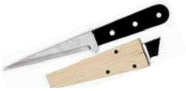
Coltello ghiaccio Ice knife Eis-Messer Couteau à glace Cuchillo para hielo