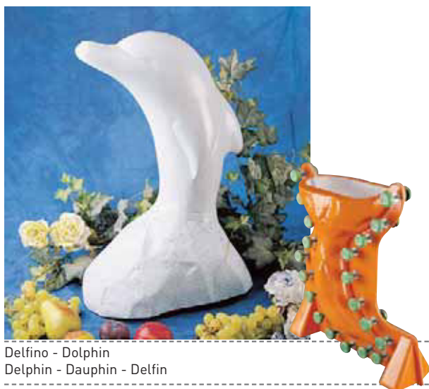
Delfino - Dolphin Delphin - Dauphin - Delfin

Reusable moulds for ice sculptures made of special plastic with an additional external orange coating of resin which makes the two shells more elastic and more resistant against ice expansion. The silicone trimming inside the shell and the fixing screws do not let the water come out. We suggest to fill the mould with water and small ice cubes. In order to obtain a more transparent sculpture we suggest to prolong the freezing process as much as possible. Recommended temperature between -10^{\circ}\text{C} and -20^{\circ}\text{C} . Before opening the mould leave it at room temperature for 10 minutes then open the mould horizontally on a table and extract the sculpture. Remove exiding ice with a cutter and polish the sculpture with a mini torch and/or a cloth.