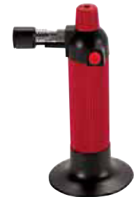
Cannello professionale Chef's torch Profi-Wärmepistole Chalumeau de cuisine Flambeador profesional