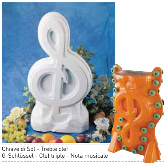
Chiave di Sol - Treble clef G-Schlüssel - Clef triple - Nota musicale