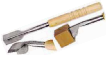
Scalpellino ghiaccio a V V shape chisel Eismeissel Ciseau à glace Cinsel a V para hielo