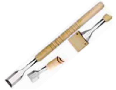
Scalpellino ghiaccio 3 lati smussati Medium flat chisel Eismeissel Ciseau à glace Cinsel para hielo