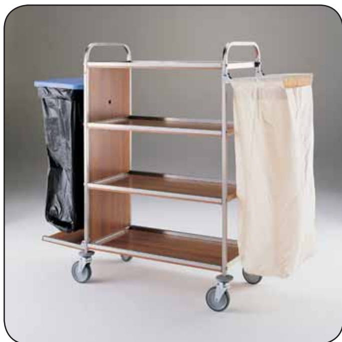
Art. 1436 S